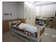
成人患者シミュレータ 'SimMan3G'