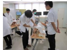
直腸診シミュレータ