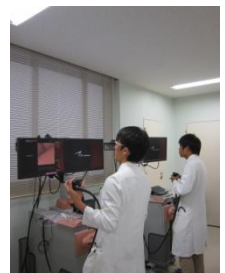
バーチャル内視鏡シミュレータ 'AccuTouch'