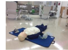
救命訓練人形 レサシアン