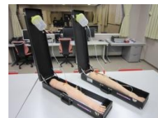
採血・点滴シミュレーター IVトレーニングアームキット